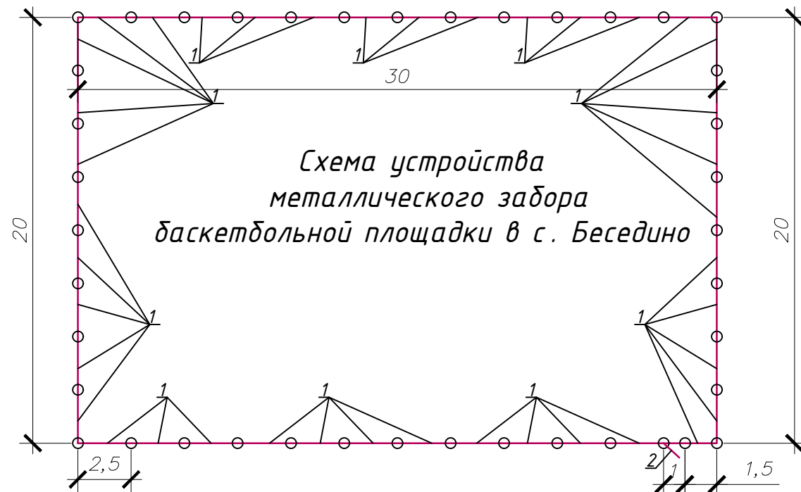
Схема устройства металлического забора баскетбольной площадки в с. Беседино